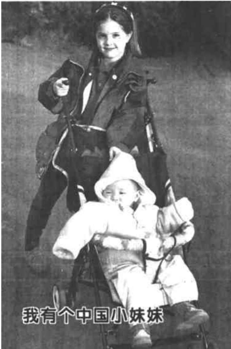
我有个中国小妹妹

12月23日，9岁的西班牙女孩安德列娅推着她的中国小妹妹在长沙烈士公园游玩。安德列娅一家不久前从湖南常宁收养了一名刚刚满月的女婴，中国女婴的到来为这个普通的西班牙家庭带来了无穷的喜悦和快乐。