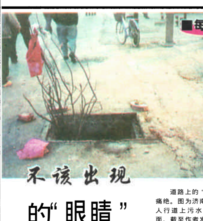
道路上的“陷阱”令人深恶痛绝。图为济南路证券大楼前人行道上污水井盖被盗窃后的场面。截至作者发稿时，该井盖尚无修复。

近日，东营工商分局济宁路工商所执法人员在黄河路中段捣毁一家专门制售诸城阳春烧烤系列产品的黑窝点。这一黑窝点融生产、销售于一体，前面为商店，后面为生产加工车间兼冷库，藏有大量尚在包装的假冒食品及大宗包装箱，成品生产日期多标为2000年12月26日和2001年1月9日，车间制作设备简陋，环境脏乱不堪。执法人员当即将假冒产品、商标和包装箱予以查没，并根据窝点的交待，对那些流通到市场上的产品依法进行收缴。笔者在此提醒广大消费者：在购买烧烤食品时注意识别，谨防买到假冒食品。（孙勇 刘美江）